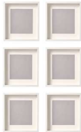
ESPACIO: 1.50 MTS. DE PARED EN ANCHO 6 obras de 32x32cm (12x12") medida incluido marco un solo artista en esa medida de pared dejando 10cm de cada lado para otros artistas $1900 para aplicaciones antes del 30 de mayo