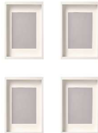
Propuesta de 150cm de ancho de pared, solo artista 4 Obras de 40cmx60cm alto (16"x20" pulgadas) incluido la medida del marco. La obra puede ser menor o igual al marco (sin espacio blanco) u$ 1900 para aplicaciones antes del 30 de mayo.